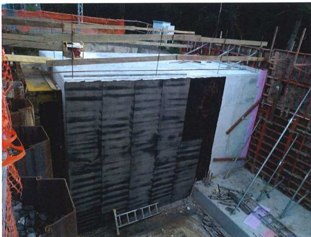
Izolácia mosta – SO 12-33-05