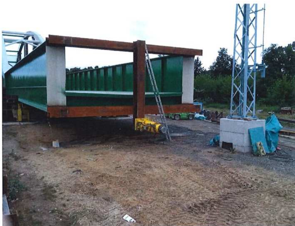
Príprava výsuvného zariadenia mosta cez rieku Morava – SO 12-33-04