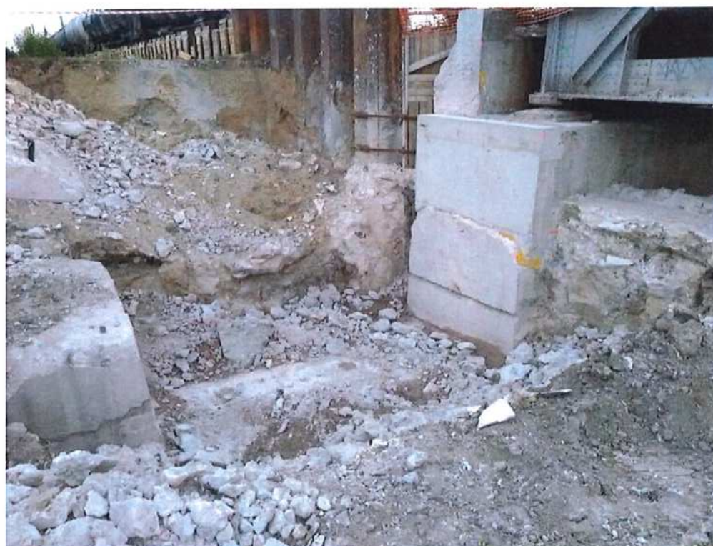
Rezanie a búranie opory ručne – SO 12-33-02