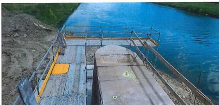
c) Nedostatočne zabezpečené výkopy a pracoviská vo výške