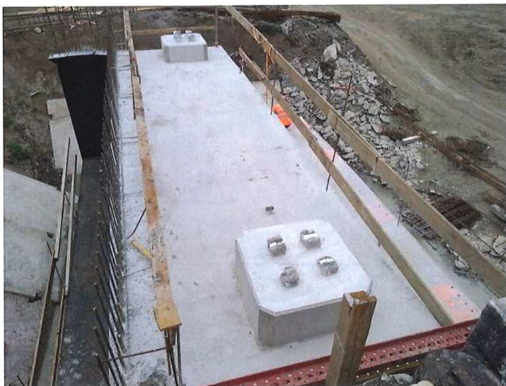
Betonáž podložiskových bločkov na opore OP2 na strane CZ – SO 12-33-04