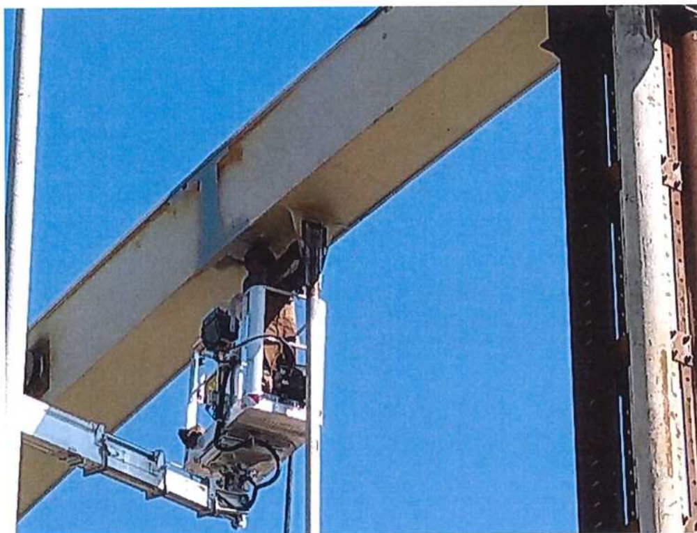
Zváranie a montáž ocelevej konštrukcie mosta cez rieku Morava – SO 12-33-04