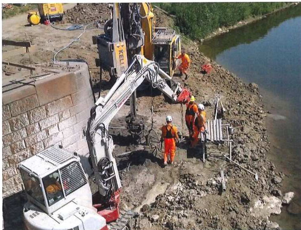
Mikropilóty pri pôvodnom pilieri P2 pre pomocné zariadenie na výsun mosta – SO 12-33-04