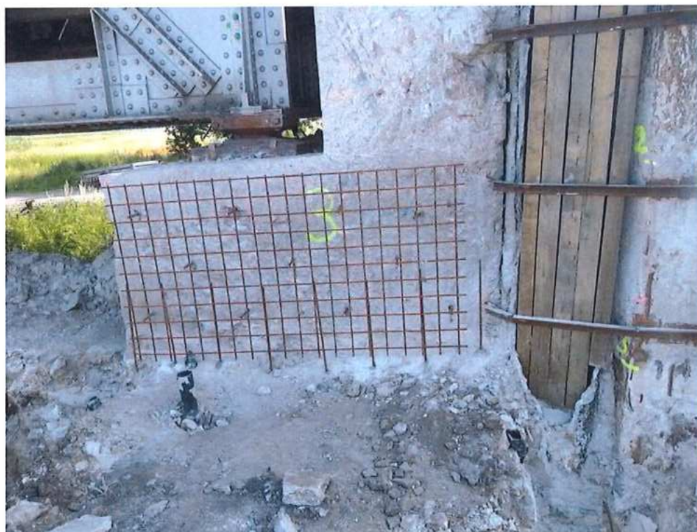
Spevnenie opôr pred odbúraním – SO 12-33-02