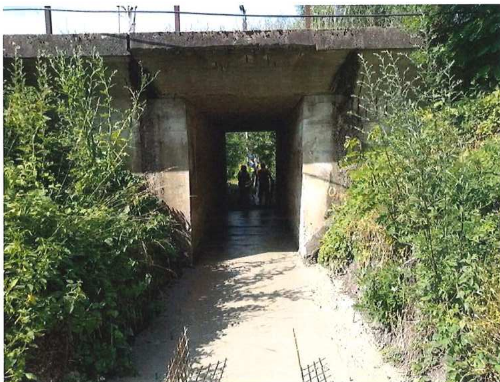
Betonáž podkladu pre osadenie rúr – SO 12-32-05