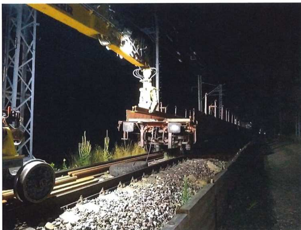
Navezenie a vykládka koľajníc