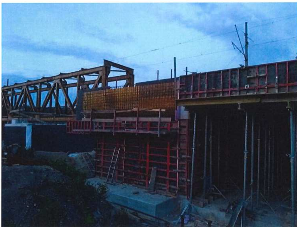
Debnenie krídla – SO 12-33-05