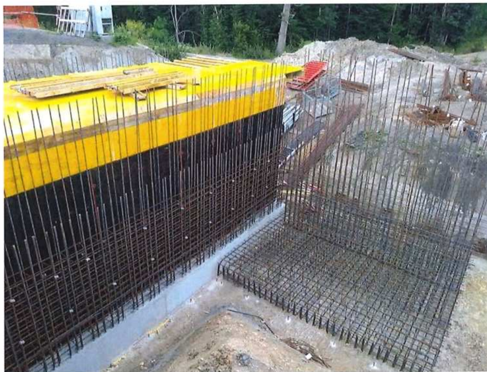
Armovanie stien a krídla - SO 12-33-05/SO 13-33-02