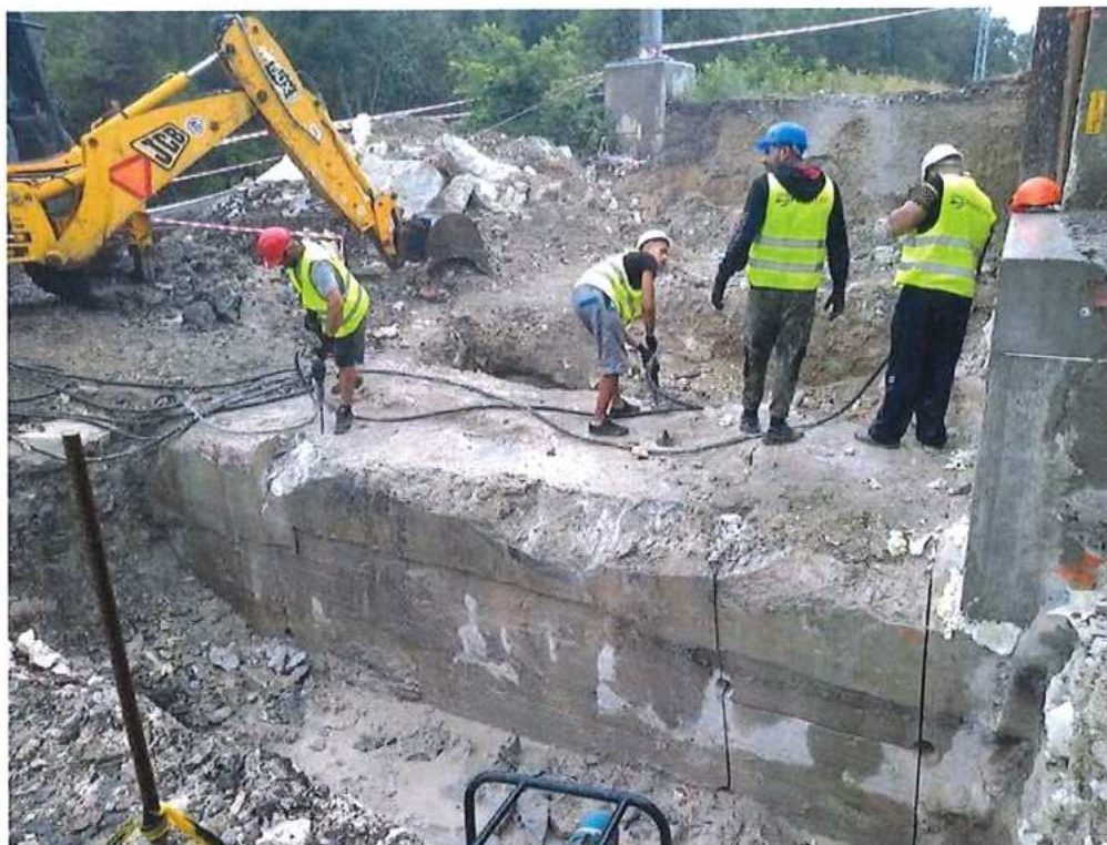
Búranie opory ručne – SO 12-33-02