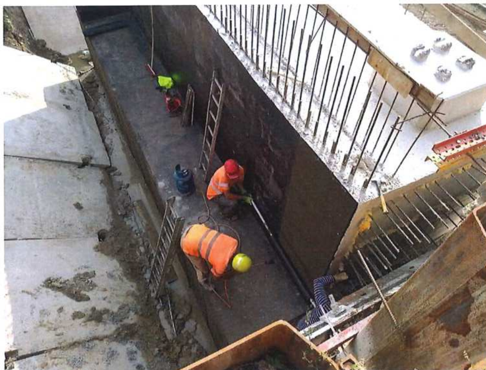
Izolácia opory OP2 na strane CZ – SO 12-33-04