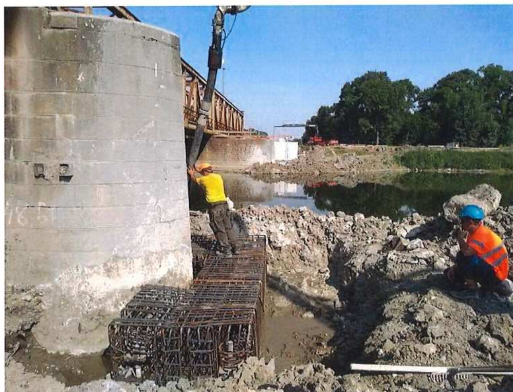
Armovací práce a betonáž pri pilieri P1 a P2 pre zriadenie podpornej plochy pre pomocné konštrukcie na výsuv mosta – SO 12-33-04