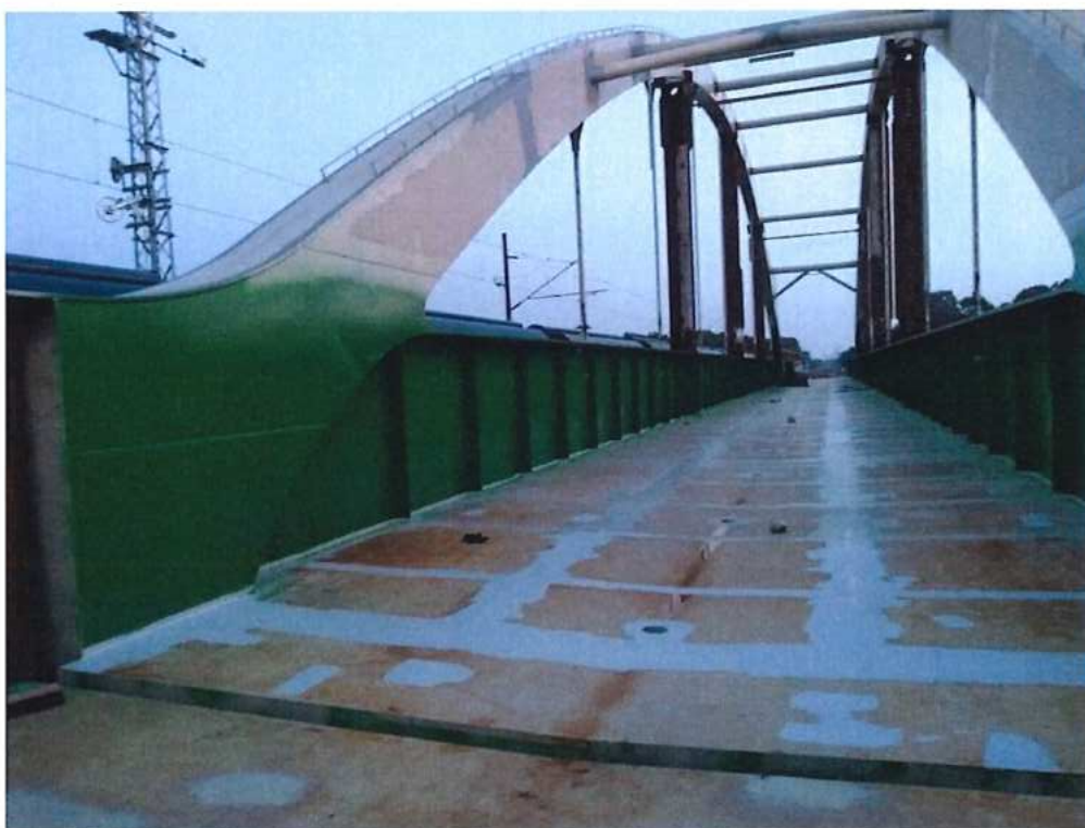
Náter oceľových častí mosta cez rieku Morava – SO 12-33-04