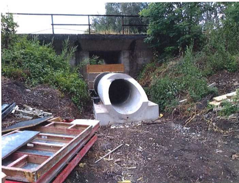
Budovanie priepustu v km 72,917 – SO 12-32-05