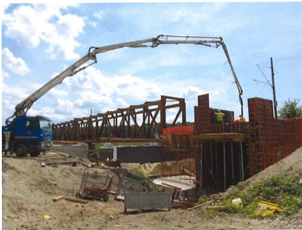
Betonáž stien a stropu – SO 12-33-05