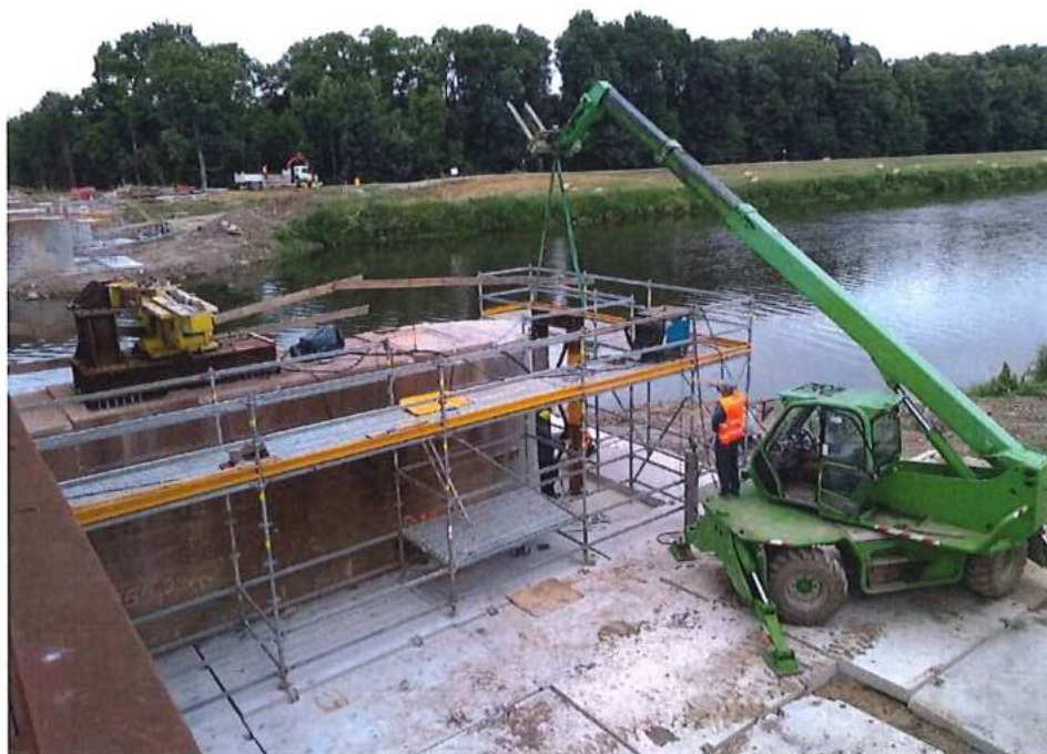
Montáž valčkových zariadení na pilier P1 – SO 12-33-04