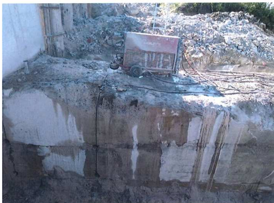
Rezanie opôr pred búraním – SO 12-33-02